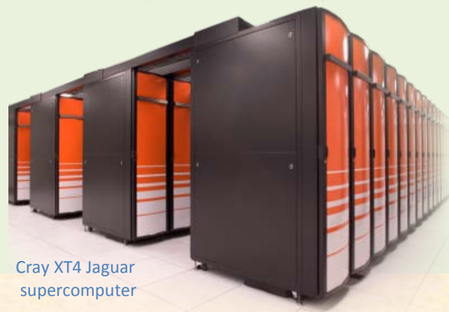
Cray XT4 Jaguar supercomputer